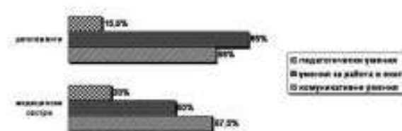
Фиг. 1. Умения, които респондентите желаят да усъвършенстват

тите и получаването на тяхното съгласие. Отговорите на двете групи респонденти се разминават значително. Само една четвърт от завършващите студенти (25,9%), но същевременно голяма част от практикуващите сестри (72%) съобщават за различни трудности, свързани с получаване на информирано съгласие от болните. Получените резултати свързваме с все още малкия практически опит на дипломантите и обстоятелството, че по време на преддипломния си стаж те работят под супервизията на опитни сестри наставници, които ги подпомагат и поемат основно отговорността за всички аспекти на тяхната практическа дейност и обучение.