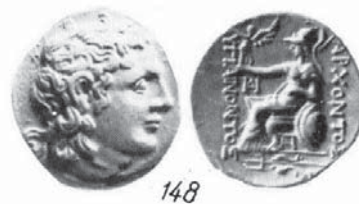
СТАТЕР НА ХИГИЕНОНТ

архонтът Хигиенонт, управлявал според Анохин в периода 210-200 г. пр. Хр.. Той не е член на семейството на Спартокидите и се жени за Алкатея, сестрата на последните двама боспорски владетели, затова на златният статер, който отсича титлата му е, „архонт“ (фиг.6) [1]. С емисията на златни статери архонтът не само ознаменува качването си на престола, но и цели да стабилизира пазара на Боспор и да го свърже с пазарите на Черно и Средиземно море. Хигиенонт е първият боспорски владетел, който сече златни и сребърни монети след продължителен кризисен период в монетосеченето на Боспорското царство през III пр. Хр.. [1], а името му се превежда като “здравомислещ, разумен” [5]. На аверса на монетата е изобразен самият владетел, гледащ на дясно без надписи и означения, а на реверса богинята Атина седи на трон, подпира се на щит и държи богинята Нике, монограми под трона и ръката на Атина, а от двете страни на фигурата има надпис “ΑΡΧΟΝΤΟΣ ΥΓΙΑΙΝΟΝΤΟΣ” [1].