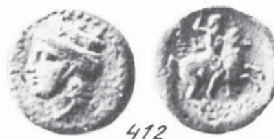
МОНЕТА НА КЕРКЕНИТИДА Фиг. 4

Твърдението, че конника е скит, се налага от медните монети на античната Керкинитида, днешната Евпатория с изобразена подобна сцена, описана от Анохин като „скит на кон“ [1]. На аверса на тези монети е изобразена богинята Тюхе с корона от крепостни кули. Според същият автор тези медни монети са сечени в периода 310-300 година пр. Хр. (фиг. 4). Хекатей Милетски в 497 г. пр. Хр. пише за „Керкинитида-скитски град на брега на Понта“. Препускащият конник с копие е твърде характерен за монетосеченето от северозападното и северно Черноморие, като се започне от Тирас и се стигне до Фанагория, с изключение на Херсонес Таврически [1,3].