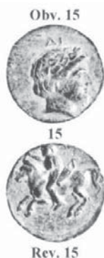
БРОНЗ НА ДИОНИСОПОЛ