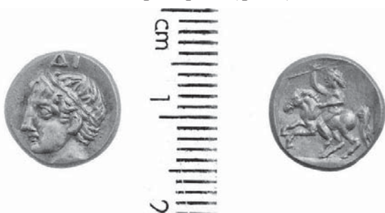
ЧЕТВЪРТ СТАТЕР НА ПАНТИКАПЕЙ Фиг. 3

втората монета въпросът е много по-сложен, защото не се намери в посочените заглавия някаква следа или податки за нейното успешно идентифициране (фиг.3).