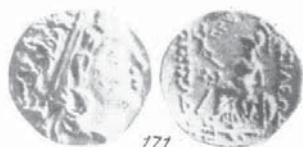
СТАТЕР НА ПЕРИСАД IV Фиг. 8

Следващият претендент, Перисад IV (около 150 – 125 г. пр. Хр.), е син на Перисад III и Камасария, и бащата и синът сечат статери от лизимахов тип по атическата монетна система (фиг.8). На аверса на статера на Перисад IV е изобразена мъжка глава с диадема гледаща на дясно, а на реверса седящата Атина, подпряна на щит и държаща в ръката си богинята Нике. Отсичането на този статер Анохин отнася към 140 - 130 г. пр. Хр. [1].