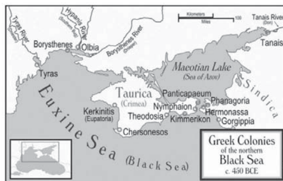
ГРЪЦКИТЕ КОЛОНИИ ПО СЕВЕРНИЯ БРЯГ НА ЧЕРНО МОРЕ ОКОЛО 450 ГОДИНА ПР. ХР