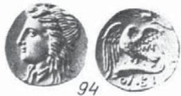
СТАТЕР НА ОЛБИЯ

на IV в. пр. Хр., отново по атическата монетна система с тегло в диапазона 2,15 - 2,09 грама [2,7]. На аверса е изобразена глава на богинята Деметра на ляво с венец от житни класове, а на реверса - делфин на ляво с надпис ОΛ. Монетата фигурира и в сайта на Одеският музей на нумизматиката (фиг.1). Тя е с диаметър 11 милиметра, дебела е 2,1 милиметра, теглото и е 2,157 грама, а пробата - 21,6 карата; монетата не е била в обръщение дълго време, което личи по остатъците от гланц, но вероятно е притискана в други монети, венецът от класове на главата на богинята е замазан, смачкани са и части от буквите на реверса. При голямо увеличение може да се проследи и последователността на работата на гравьора при изработването на щампите. Металите в хемидрахмата се разпределят така: Au - 92,6 %; Ag - 4,01 %; Cu - 4,47 %; Zn - 0,68 % и Ni - 0,22 %. По мнението на главен асистент Бояджиев, който извърши спектралният анализ, съдържанието на метали отговаря на това на антична монета, а съдържанието на никел може да служи като своеобразна гаранция за нейната автентичност. Препечатването на златна монета с малко тегло е сложна процедура и при последвалите нагривания количеството никел от 0,007 грама, по негово мнение, би трябвало да изгори.