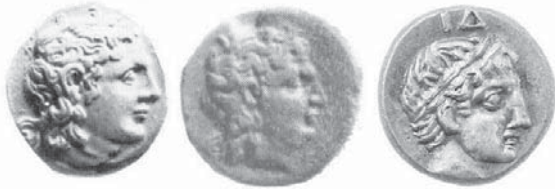
РЕВЕРСИ НА МОНЕТИ НА ХИГИЕНОНТ И ЧЕТВЪРТ СТАТЕРА НА ПАНТИКАПЕЙ Фиг. 7