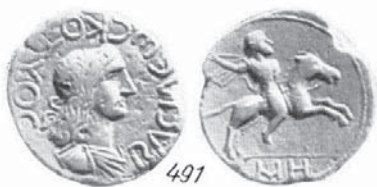
СЕСТЕРЦИЙ НА КОТИС II