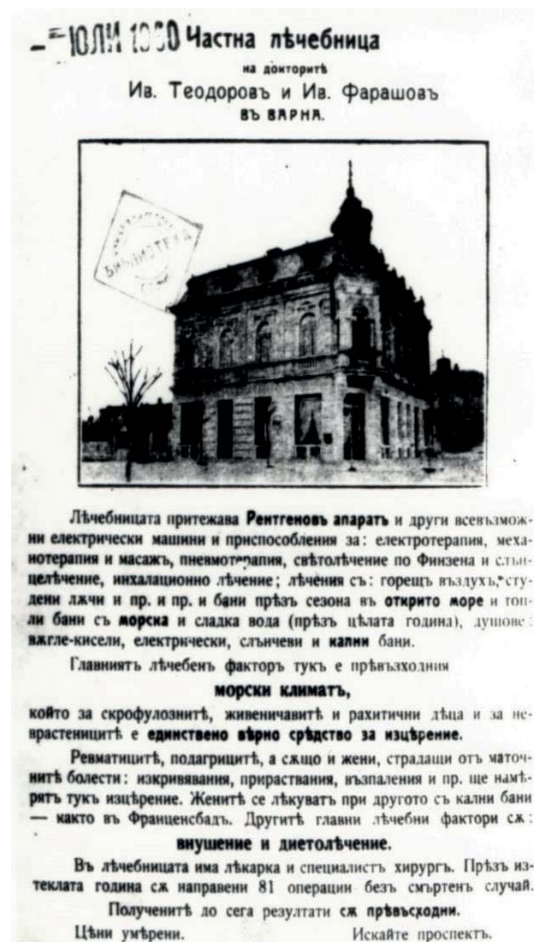
Фиг. 2. Рекламна брошура на първата частна физиотерапевтична лечебница в България публикувана във Варнанската преса.