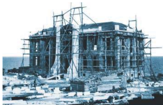
Фиг. 12. Строежа на сградата на Морската биологична станция с Аквариум към Софийския университет – 1906 г.

Сградата на Института по рибни ресурси – ССА е построена по идея на Н.В. цар Фердинанд I през 1906 – 11 г. Проектът е дело на архитект Дабко Дабков.