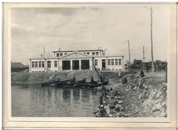
Фиг. 11. Тържище - Български риболовец"

Дотогава пазарлъкът между рибари и търговци е станал в една неугледна дъсчена барака.