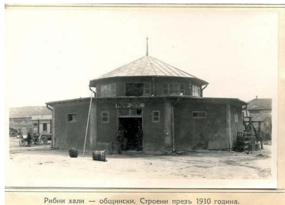
Рибни хали — общински. Строени през 1910 година.

През 1910 г. общината построява общински рибни хали.