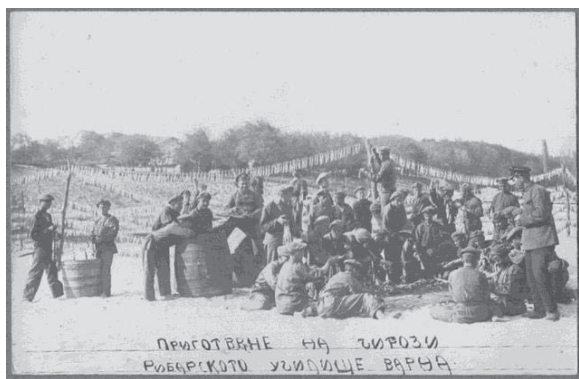
Фиг. 9. Приготвяне на чирози – Рибарското училище във Варна

През 1920 г. се създават първите риболовни кооперации във Варна, като липсата на средства за закупуване на индивидуални рибарски уреди, пособия и съдове кара рибарите да се сдружават. Само за няколко години броят на рибарските кооперативи се увеличава значително, като през 30 те години се появяват и големи частни дружества, които се занимават не само с улов, но и с търговия на едро и консервиране на риба.