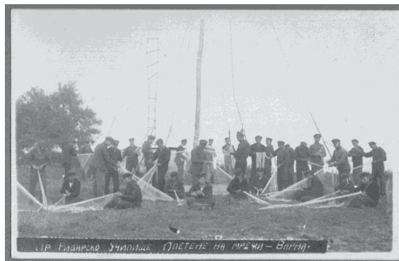
Фиг. 13. Приложно рибарско училище Варна – плетене на мрежи

Използването на Аквариума по предназначение се забавя, поради войните за обединението на българския народ (1912 – 13 г.; 1915 – 18 г.) и превръщането му в квартира на войскови части и тракийски бежанци, а впоследствие - във Военноморско (1918 – 22 г.) и Рибарско училище (1922 – 1930 г.).