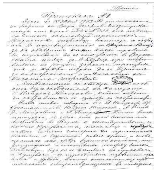
Фиг. 3. Протокол № 1 за създаване на Житарска корпорация – 1902 г.

следва да се спазват при извършване на покупко – продажбите. Обмислят се мерки за подобряване работата по сключване на сделките.