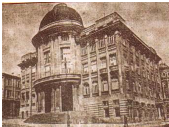
Фиг. 4. Сградата на ВТИК и Стоковата борса до 1947 г.

Варненския общински съвет взема решение на 12.11.1926 г. да предостави терен с площ от 700 кв.м. на ул. „Преславска”, на който ВТИК и борсата построяват своя собствена монументална сграда, тържествено осветена на 23.11.1935 г. Понастоящем сградата е Щаб на военноморските сили.