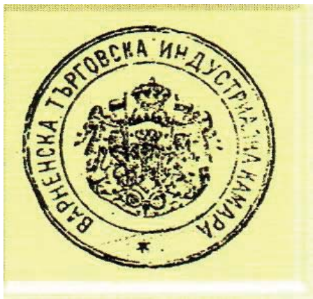
Фиг. 2. Първият официален печат на ВТИК

Първият председател на ВТИК С. Бабаджов (1853-1936 г.) е роден в Жеравна. Завършил е Робърт Колидж в Истанбул. Той работи като началник на телеграфопощенската станция във Варна, директор на Българското търговско параходно дружество, а в периода 1895 – 1896 г. е председател на ВТИК.