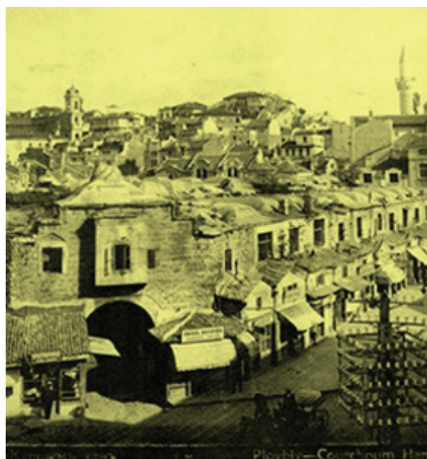
Фиг. 5. Куршум хан, Пловдив

Като често от този търговски комплекс следва да се посочи и безистенът на София, който се локализира в близост до посочените по-горе сгради. По аналогичен начин в центъра на Пловдив е съществувал безистен, който е изграден в края на XIV в. Куршум хан е бил най-големият кервансарай между Константинопол и Белград и е построен на площ от 3600 кв.м., а непосредствено зад него е разположена другата масивна сграда – безистен, който е бил търговският център на града. Безистенът е средище на големите пловдивски търговци – дубровничани, евреи и арменци. Според рисунка от XX в. безистенът е представлявал масивна сграда с 6 кубета, покрити с олово, като има 4 порти и е с обща площ около 500 кв.м.