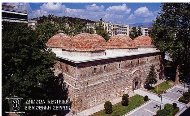
Фиг. 2. Безистенът в Серес, Гърция