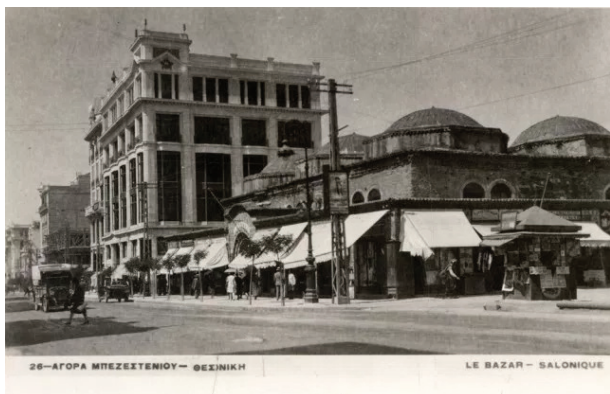
Фиг. 1. Безистенът в Солун, Гърция

вуват в балканските страни (и не само Балканите), като някои от тях все още изпълняват търговски функции (Солун - Гърция, Истанбул и Одрин - Турция и др.), Други са преобразувани в музеи или културни центрове (Серес - Гърция, Ямбол - България, Никозия - Кипър и др.) А други, за съжаление, са оставени да е рушат (Скопие – Северна Македония, Шумен - България и др.).