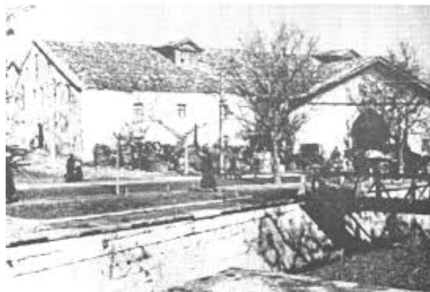
Фиг. 4. Безистенът в Шумен

С включването на територията на България в Отоманската империя, която се разширява на три континента – Азия, Африка и Европа, през Средновековието се увеличават физическите обеми на стоки, които се произвеждат и търгуват на заселената с българи територия.