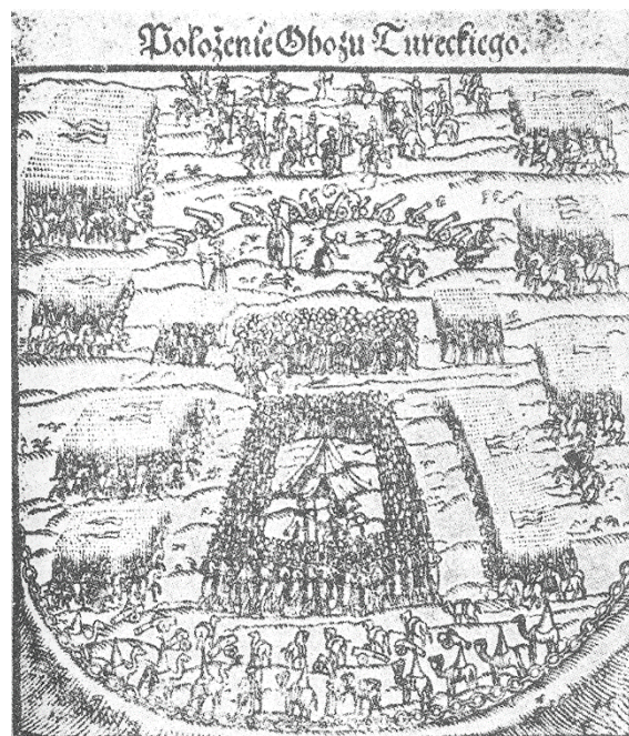
Фиг. 2. „Варненската битка – старинна скица, Полша“

Особеният ни интерес към тази графика се появи през 2010 година, когато я открихме в монографията на Винценти Свобода „Варна 1444“ с надпис на полски език: „Разположение на турския лагер“ (Фиг. 1) (22). „Особен интерес“ защото тя е отпечатана и в друга монография, „Паметна битка на народите“ на Бистра Цветкова, без надписа на полски език, само с бележка отдолу: „Варненската битка - старинна скица, Полша“ (Фиг. 2) (24). Изображенията на средновековните битки не се отличават с голяма достоверност, а и поради недостатъчно познания за битката тогава, графиката остана без внимание от наша страна. Своите съмнения относно достоверността вероятно е имала и Цветкова, но не е могла да синхронизира изображението с източниците