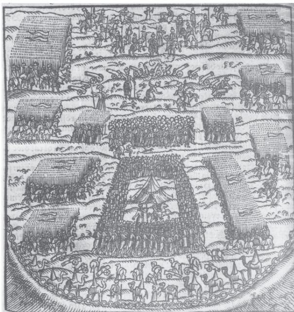
Фиг. 1. Графика от 1564 год.

Keywords: Varna, battle, sultan, janissaries, king, attack, death