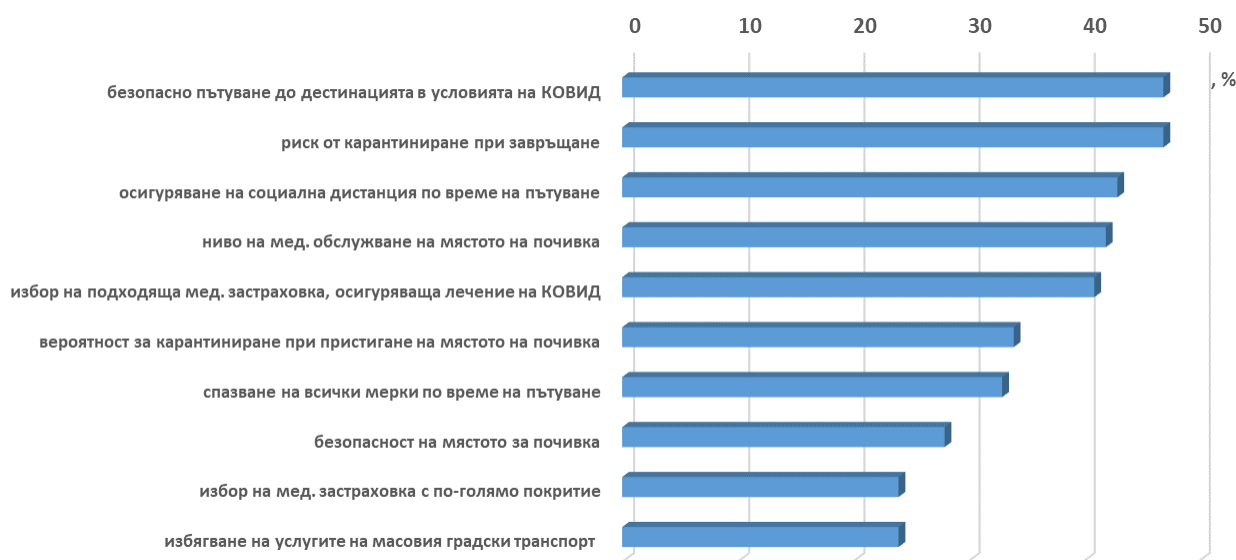
Фигура 3. Условия за нормалното протичане на почивка

Според доклада на Европейската комисия по туризъм, въпреки високите нива на ваксинация в голяма част от западноевропейските страни и отпадане на част от ограничителните мерки с цел улесняване на пътуванията, възстановяването на европейския туризъм на нива от преди пандемията също не се очаква да стане преди 2024 г. Туристите, пристигнали в Европа от САЩ през 2021 г. са с 90 % по-малко в сравнение с 2019 г. Част от причините за бавното възстановяване на потока от туристи са непрекъснато променящите се ограничения и мерки в различните държави, което кара хората да се преориентират от пътувания на дълги разстояния към пътувания на близки разстояния, най-често в собствената си държава. Независимо от прогнозата, според която броят на туристите в Европа за 2021 г. ще бъде с 60 % по-малко, в сравнение с 2019 г., 2021 година се очаква да бъде по-добра във финансово отношение от предходната, когато броят на туристите е бил със 77% по-малко в сравнение с 2019 година.